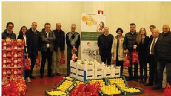
La filiera degli agrumi siciliani a Brescia per dare un assaggio dell'Expo 2015 sulle tavole locali