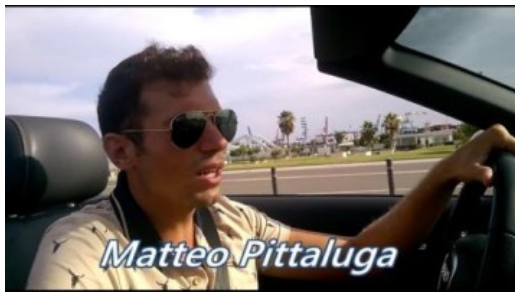
Da zero, a imprenditore full time su internet.. Ecco come! Spiegato step by step Soldi online in 20 min