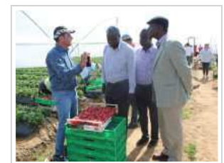
DELEGAZIONE AFRICANA IN VISITA IN ITALIA