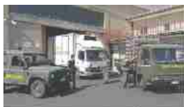
AZIENDA DI PATERNÒ DONA AGRUMI AL BANCO ALIMENTARE