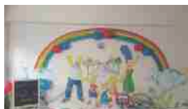
PATERNO': Inaugurata Ludoteca al Distretto Sanitario. i giochi donati anche dal nostro quotidiano - Le Foto