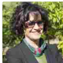
Distretto Agrumi: la Sicilia agrumicola di qualità sbarca in Polonia