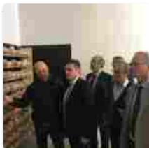
Biofabbrica di Ramacca "Bandiera: "Occorre rilanciare la biofabbrica di insetti"