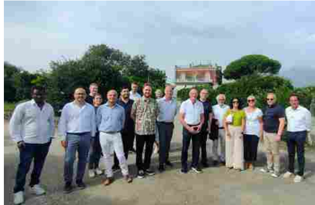
La delegazione danese in Sicilia

A Catania, in Sicilia, si tenuto un incontro di rilevanza internazionale: ospite del Distretto Produttivo Agrumi di Sicilia, è stata accolta una delegazione di parlamentari danesi, membri della Environment and Food Committee, insieme all'Ambasciatore danese in Italia, Anders Carsten Damsgaard. L'incontro è stato incentrato su temi cruciali quali la sostenibilità e l'impatto ambientale del comparto agroalimentare.