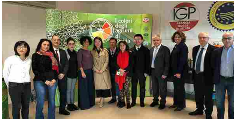
Una recente missione di operatori cinesi in Sicilia