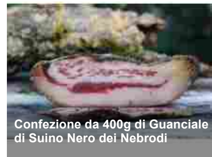
Confezione da 400g di Guanciale di Suino Nero dei Nebrodi