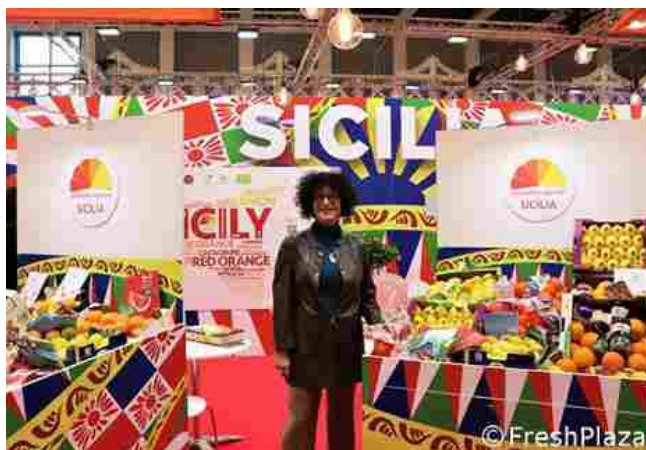
Argentati, tra i due stand del Distretto

Se da un lato, cioè, si deve trasmettere la bontà delle materie prime siciliane (Arance di Ribera Dop, e le Igp Arancia Rossa di Sicilia, Limone dell'Etna, Limone Interdonato, Limone di Siracusa) e una produzione biologica di tutto rispetto, dall'altra è necessario che vengano riconosciuti professionalità e know-how della filiera agrumicola, dalla produzione alla trasformazione, con i suoi parametri di qualità, serietà delle aziende produttrici, ambiente di provenienza. Questa operazione è possibile "solo sapendo intercettare e utilizzare tutte le risorse a disposizione", per la rappresentante del Distretto Produttivo Agrumi di Sicilia, a cominciare dal PNRR e seguendo la strategia Farm to Fork della Comunità Europea.